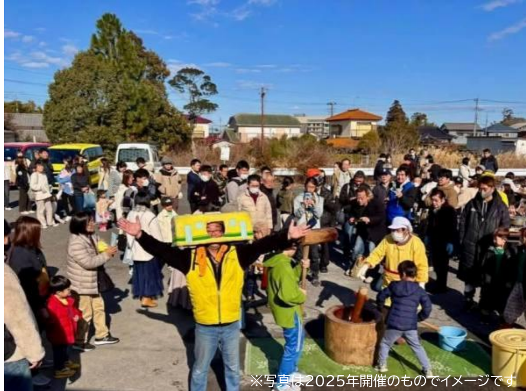
※写真は2025年開催のものでイメージです