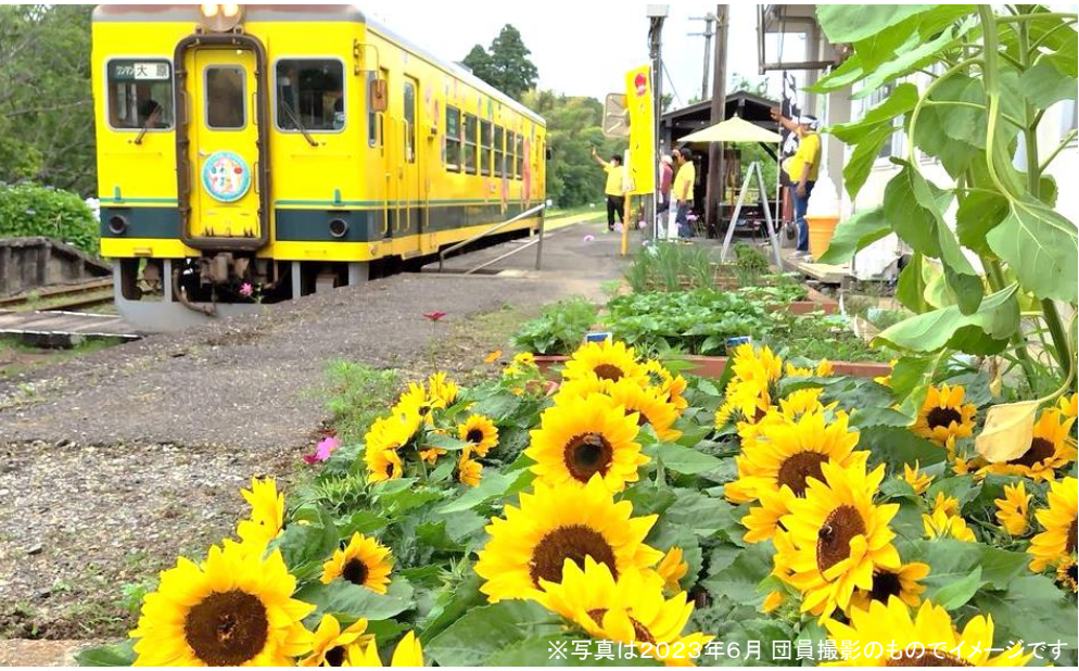
※写真は2023年6月 団員撮影のものでイメージです