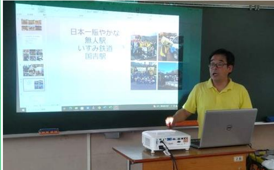
団長・掛須が大多喜高校へお邪魔し、「出前授業」を行いました。「行ってみたい」鉄道、そして高校とはという共通のテーマのもと、生徒の皆様と熱い議論が交わされました。

梅雨も過ぎれば、いすみ鉄道沿線も夏本番。先日ウクライナからの学生さんが種を蒔いてくださったひまわりも、夏の訪れを知らせようとするように、国吉駅で咲き始めています。行動制限もなくなり、久々に「暑い夏」が皆様にも訪れるところでしょうか。夏を五感で堪能できるいすみ鉄道沿線へぜひお越しください。応援団も国吉駅でお待ちしています。