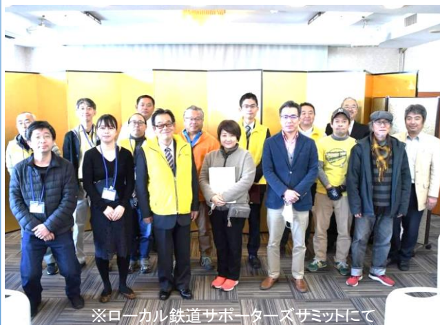
※ローカル鉄道サポーターズサミットにて

餅つき大会を盛況のうちに開催することができ、2023年も幸先の良いスタートを切ることができました。今年も国吉駅を「日本一賑わう無人駅」へと目指す取り組みをとおして、いすみ鉄道と沿線地域、そして各地のローカル鉄道の発展のため、努力してまいります。