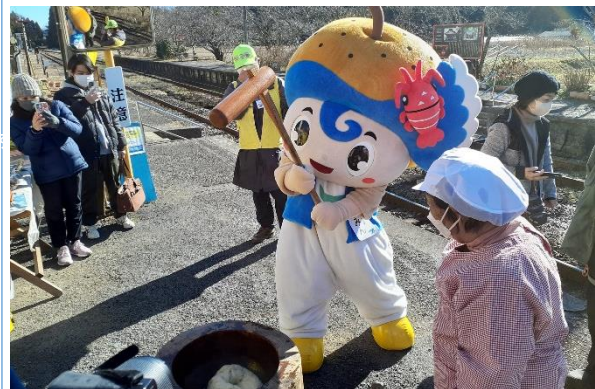
いすみ市のマスコット・いすみんも遊びにきてくれました。つき手に飛び入り参加し、頑張ってくれました。

新年1月2日、いすみ鉄道応援団の正月恒例行事、餅つき大会を国吉駅にて行い、約250名のお客様に、もち米50kgを用いたつきたてのお餅をふるまいました。地域の皆様のご協力により用意されたお餅は、次々に手に取っていただくほどの大盛況で、「日本一賑わう無人駅」にふさわしい、2023年の幸先の良いスタートとなりました。真価の間われる2023年、今年も応援団一同、皆様とともに一層努力してまいります。